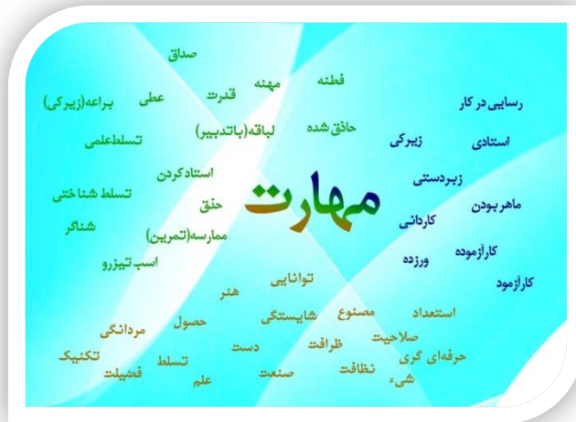
شکل ۱- سپهر معنایی واژه مهارت در سه زبان فارسی، عربی و انگلیسی (فارسی: آبی، عربی: سبز،

به نوعی ویژگی‌ها و لازمه‌های مهارت را از این ریشه‌شناسی می‌توان نتیجه گرفت. به این نحو که مهارت موجب تمایز با دیگران، فهم و تشخیص و موجب قضاوت خوبی در مورد موضوعی می‌شود. (علم داشتن کافی نیست و باید برای قضاوت کارشناس و کاردان و مهارت چیزی را داشت).