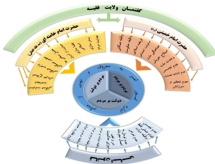
نمودار ۱. الگوی مفهومی تحقیق

در این پژوهش سه بعد مذکور در اصل هشتم قانون اساسی به شکلی هدف‌دار و ساختارمند مورد واکاوی دقیق قرار گرفته و در نهایت از دل این کندوکاوها، الگوی سیاستی اداره امور امر به معروف و نهی از منکر استخراج شده است.