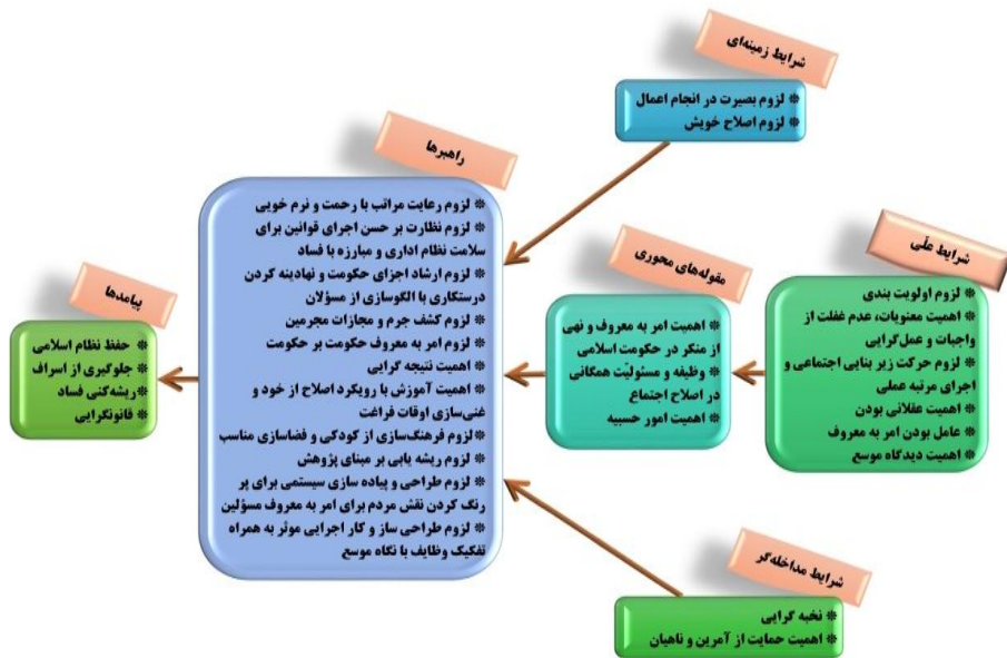
شکل ۲. الگوی پارادایمیک اداره امور امر به معروف و نهی از منکر

در این الگو، نمودار فرآیندی متغیرهای ورودی و متغیرهای فرآیندی در شش بخش مقوله های محوری، شرایط علمی، شرایط مداخله گر، زمینه ها، راهبردها و پیامدها تقسیم شدند. از آنجا که محققین قصد داشتند تا به "ارائه الگو" بپردازند، لذا روش نظریه مبنایی را برگزیدند. در این روش با استفاده از اطلاعات گردآوری شده از منابع گوناگون و انجام بررسی های همه جانبه، رویکردهای اصلی در اداره امور امر به معروف و نهی از منکر از منظر حضرت امام خمینی (رحمه الله علیه)، حضرت امام خامنه ای (مدظله العالی)، قوانین جمهوری اسلامی ایران و تجربیات نظام مقدس جمهوری اسلامی ایران استخراج گردید تا با بیکر بندی و شکل گیری منسجم و نظام مند، بتواند در قالب یک الگوی همه جانبه و کل نگر ظاهر شود.