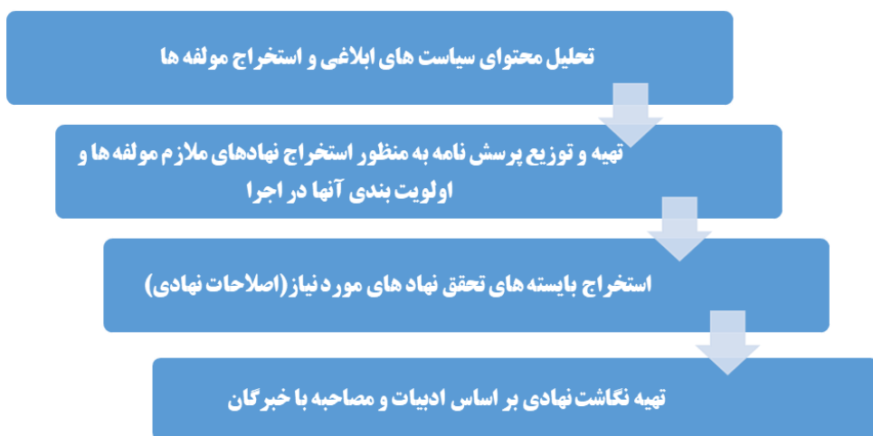
شکل شماره ۳؛ فرایند شکل‌گیری نگاشت نهادی

این پژوهش، به نهادهای مورد نظری که در تحقق اهداف سیاست‌های مذکور نقش آفرین هستند، پرداخته و مسئولیت ذی‌نفعان به وسیله نگاشت نهادی مورد مذاقه قرار گرفته است. فرایند حصول آن نیز به شرح ذیل می‌باشد: